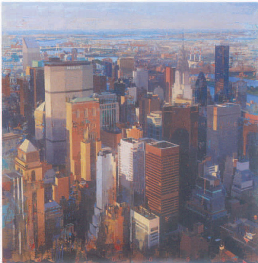
NY 120 x 120 cm Acrílico sobre madera