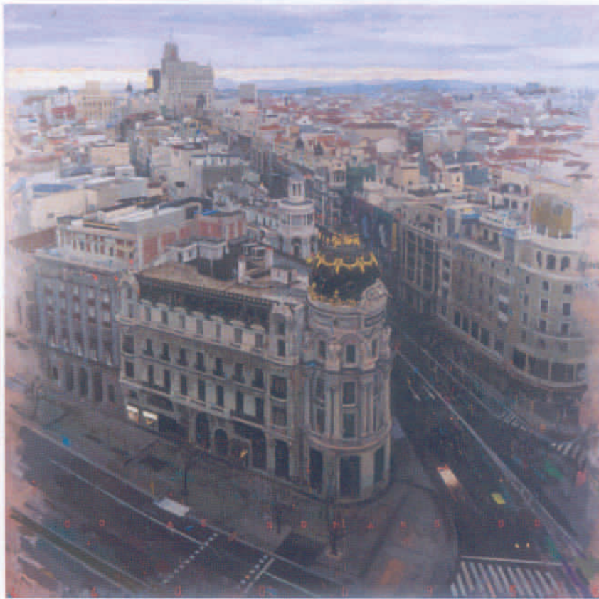
Donde fueres 180 x 180 cm Acrílico sobre madera