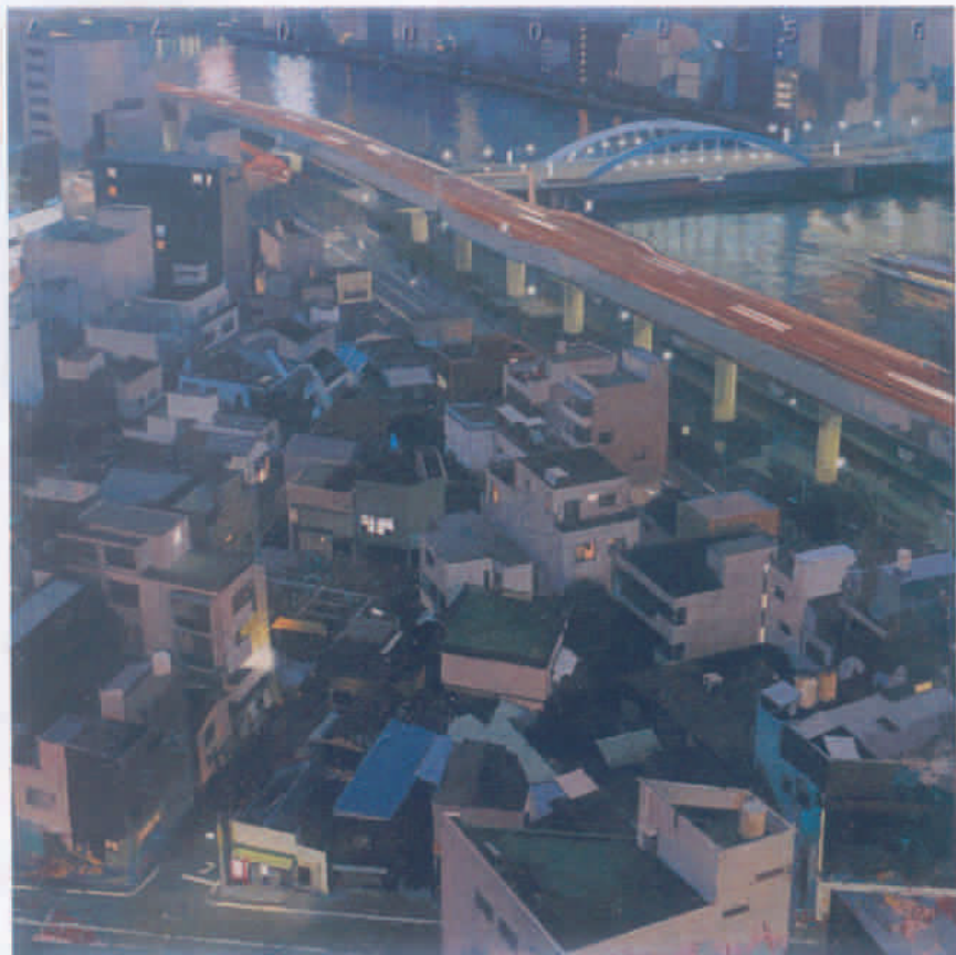
Mise 53 x 53 cm Acrílico sobre tela

“El obsesivo racionalismo urbanista ha generado una singular mística del espacio abierto”