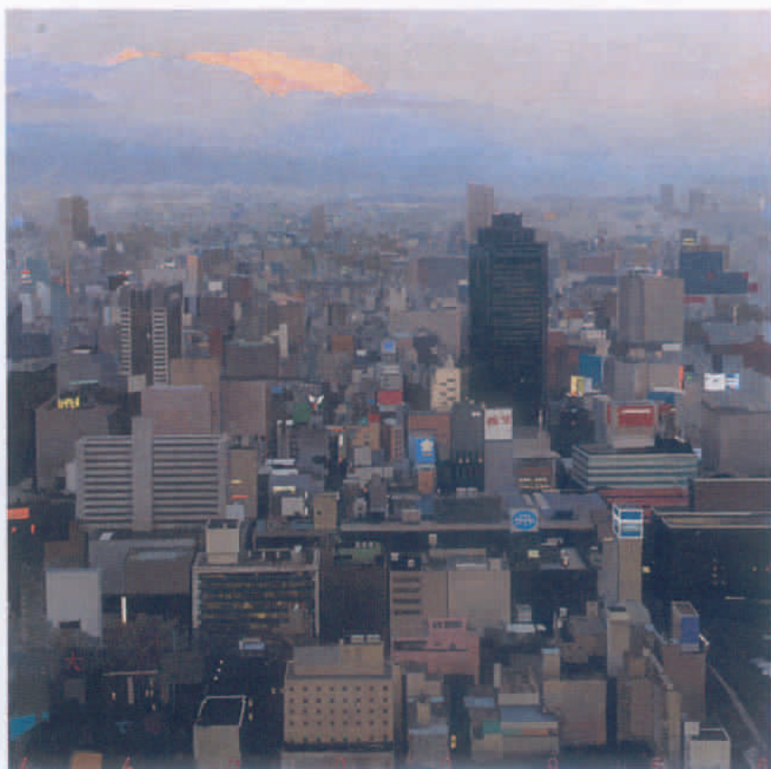
Osaka 91 x 91 cm Acrílico sobre tela