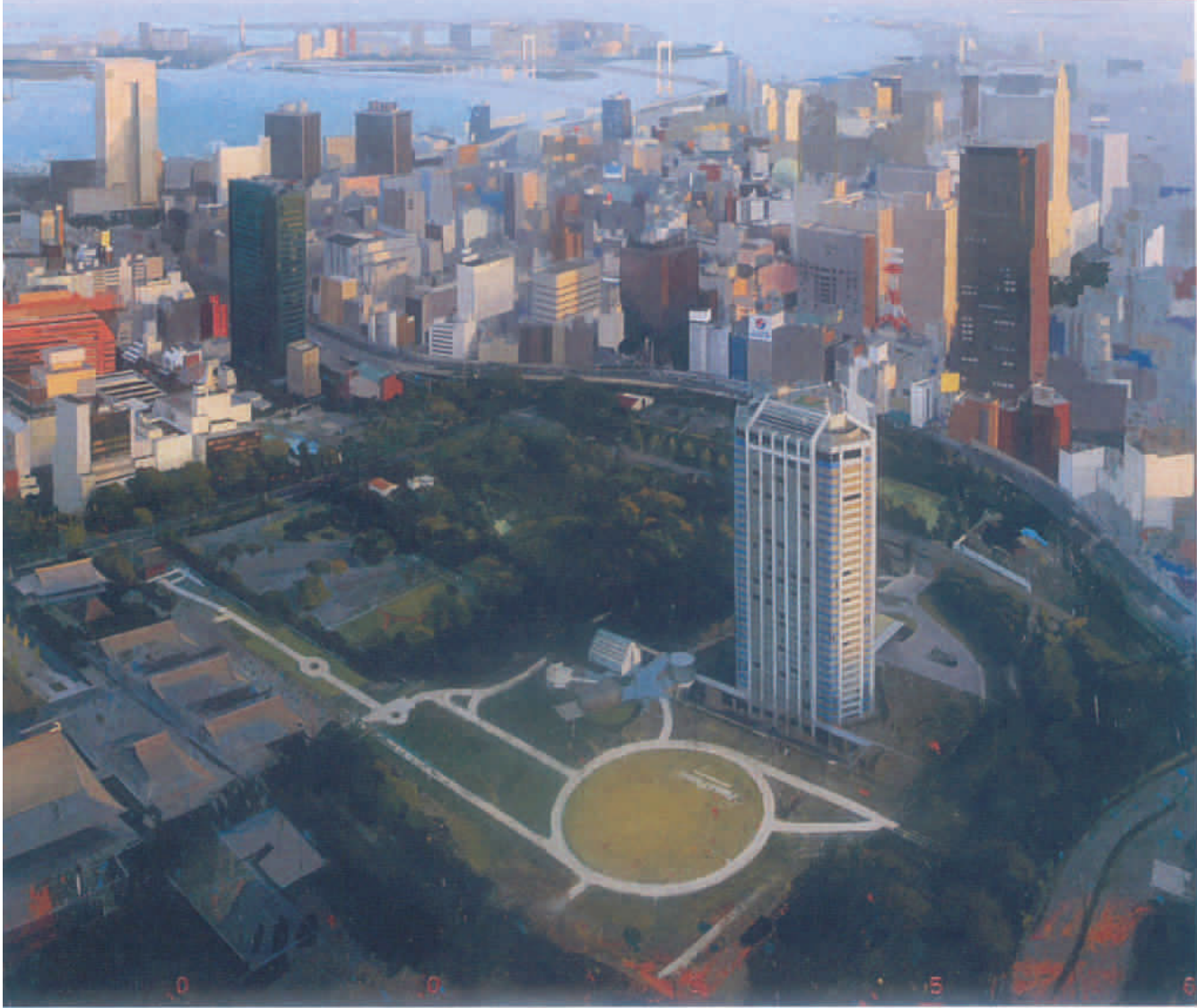
Tokyo Bay 120 x 200 cm Acrílico sobre tela

“El obsesivo racionalismo urbanista ha generado una singular mística del espacio abierto”